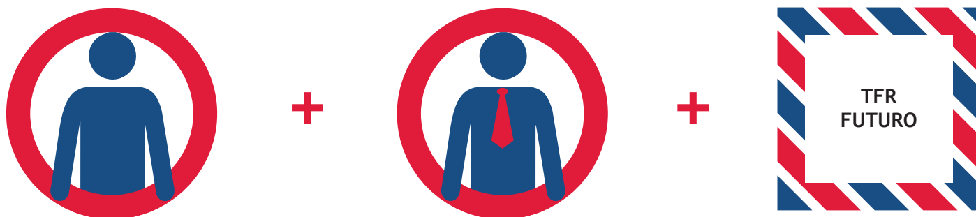
CONTRIBUTO PERSONALE la cui entità è stabilita dagli accordi collettivi

Se l'adesione è collettiva la contribuzione è così composta: