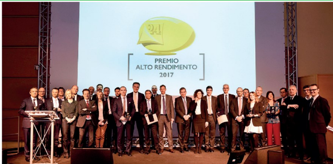
Alto Rendimento. La cerimonia di premiazione in occasione della ventesima edizione della rassegna